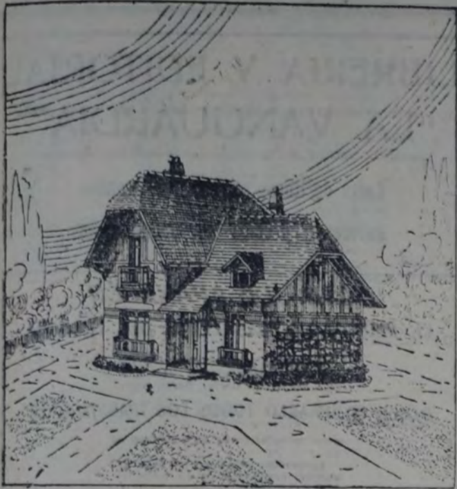
PERSPECTIVA DEL CONFORTABLE CHALET PARA FAMILIA.

La perspectiva que acompaña a las dos plantas, da una grata impresión del conjunto, bien atrayente por el exterior.